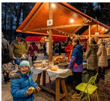
In Egg (Bild oben) und in Birrhard besucht der Samichlaus den Markt.